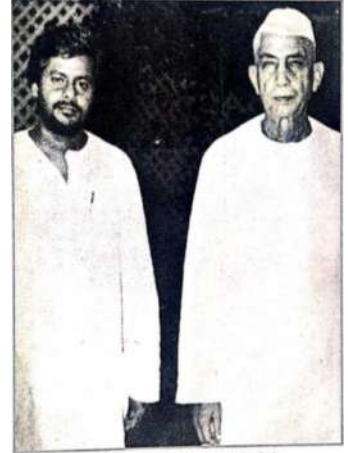
ब्रजराज चौधरी (बाएं) और अखिलेश यादव (दाएं) का एक संयुक्त चित्र 12 नवम्बर 2017, नई दिल्ली-2017